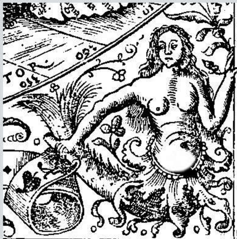
Pomponii Melae de orbis situ libri tres, cum commentariis Joachimi Vadiani. Add. Joachimus Vadianus et Ioannes Camers, 1530, p. 19 Cote : I 303