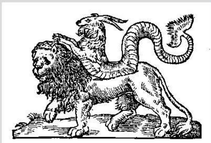
Description de la Limagne d'Auvergne en forme de dialogue, avec plusieurs médailles, statues, oracles..., Traduit du livre italien de Gabriel Symeon, en langue françoise, par Antoine Chappuys du Dauphiné, 1561, p. 33 Cote : Ip 454