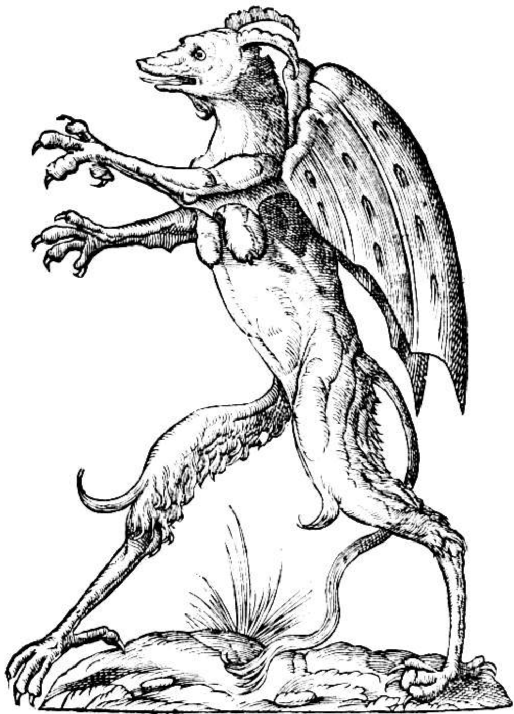
Ulyssis Aldrovandi Opera , 1599, p. 364 "Monstrum alatum, & cornotum instar Cacodaem onis" Cote : lg 0047