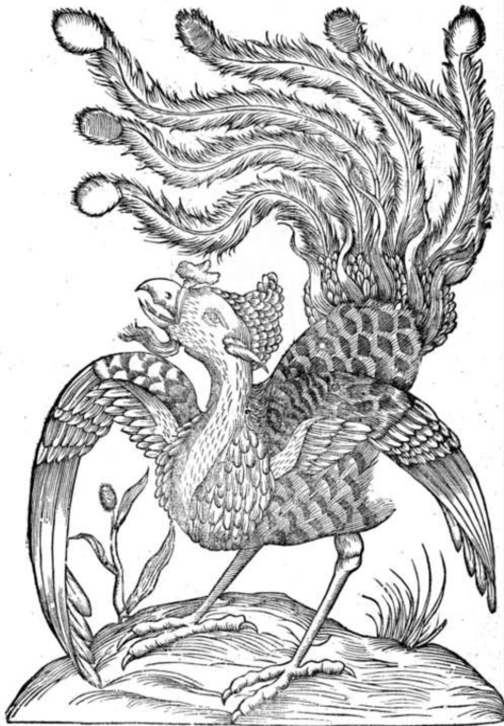
Ulyssis Aldrovandi Opera , 1599, p. 324, "Gallus Indicus auritus tridactylus" Cote : lg 0047